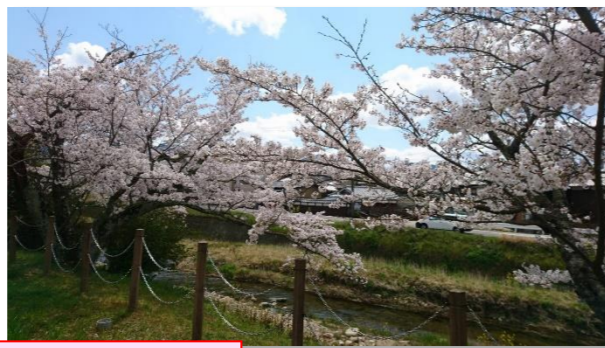
自宅近くの有馬川の桜と 金仙寺湖のつつじ